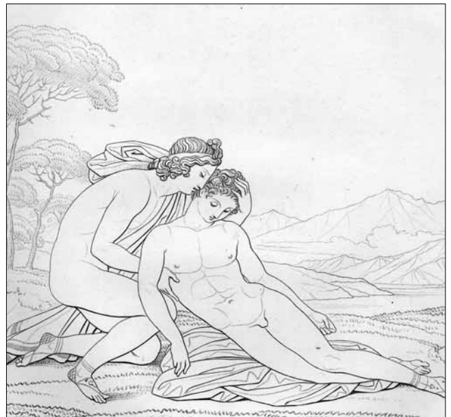
Girodet, Mort d'Hyacinthe

Je me permets de vous souligner que certains employeurs, dont le gouvernement fédéral, offrent à leurs employés la possibilité de retenir à la source les contributions pour dons de charité