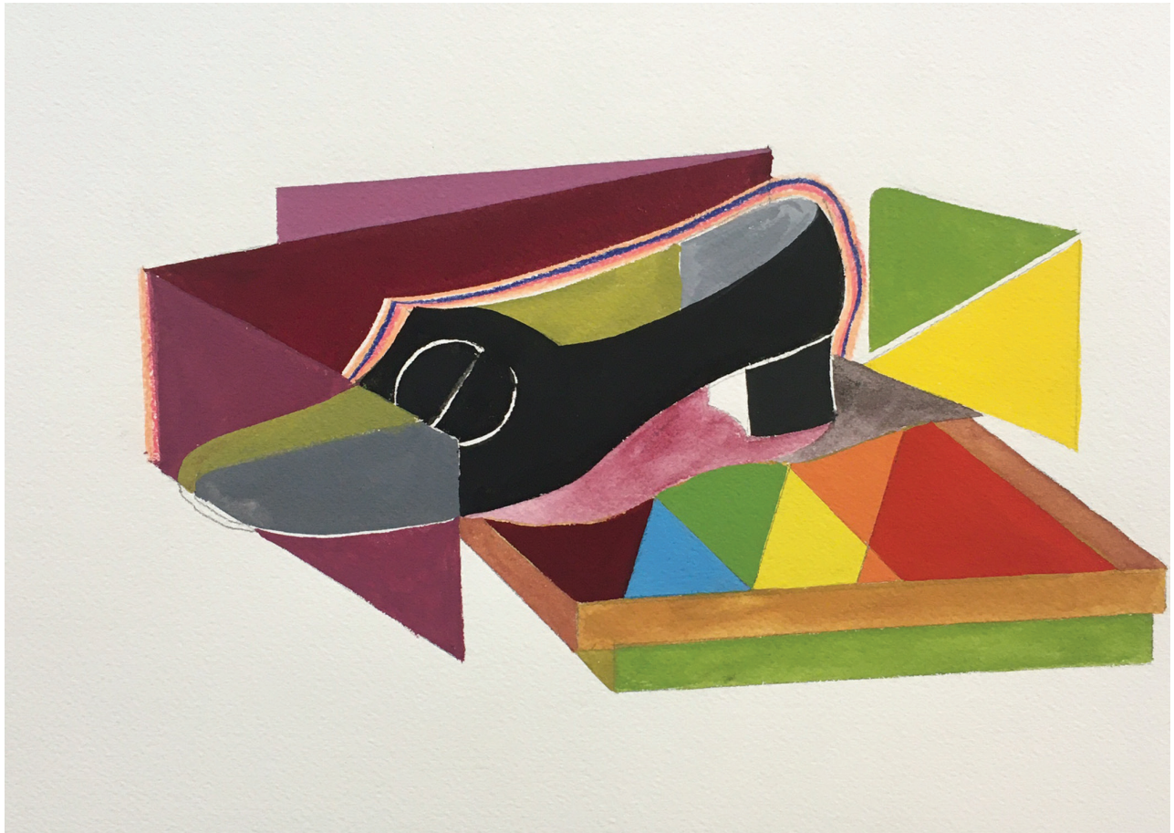
MICHEL DAIGNEAULT, Suzy chaussure dans sa boîte .02 , 2022, 23 x 29 cm. Signé par l'artiste.