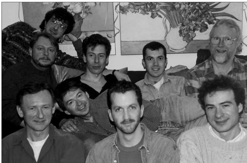
Quelques membres des Archives gaies du Québec.

Québec, il a aussi souvent vanté les mérites de notre démarche aux réunions de la Coalition et autres instances communautaires. Lors de son départ pour Toronto, il nous a donné une bonne partie de ce qui aujourd'hui constitue son fonds. Une fois installé là-bas, il ne nous a pas oublié puisqu'il a commencé à nous faire parvenir des exemplaires des textes qu'il rédigeait alors, notamment sur son implication dans un projet pour rendre accessible en français les informations et les services concernant les personnes atteintes du VIH. Sa mort en 1991 a privé ses amis ainsi que