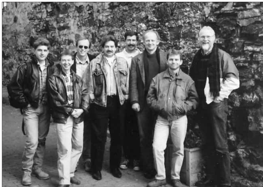
Les gars en voyage à Québec le 15 octobre 1994.