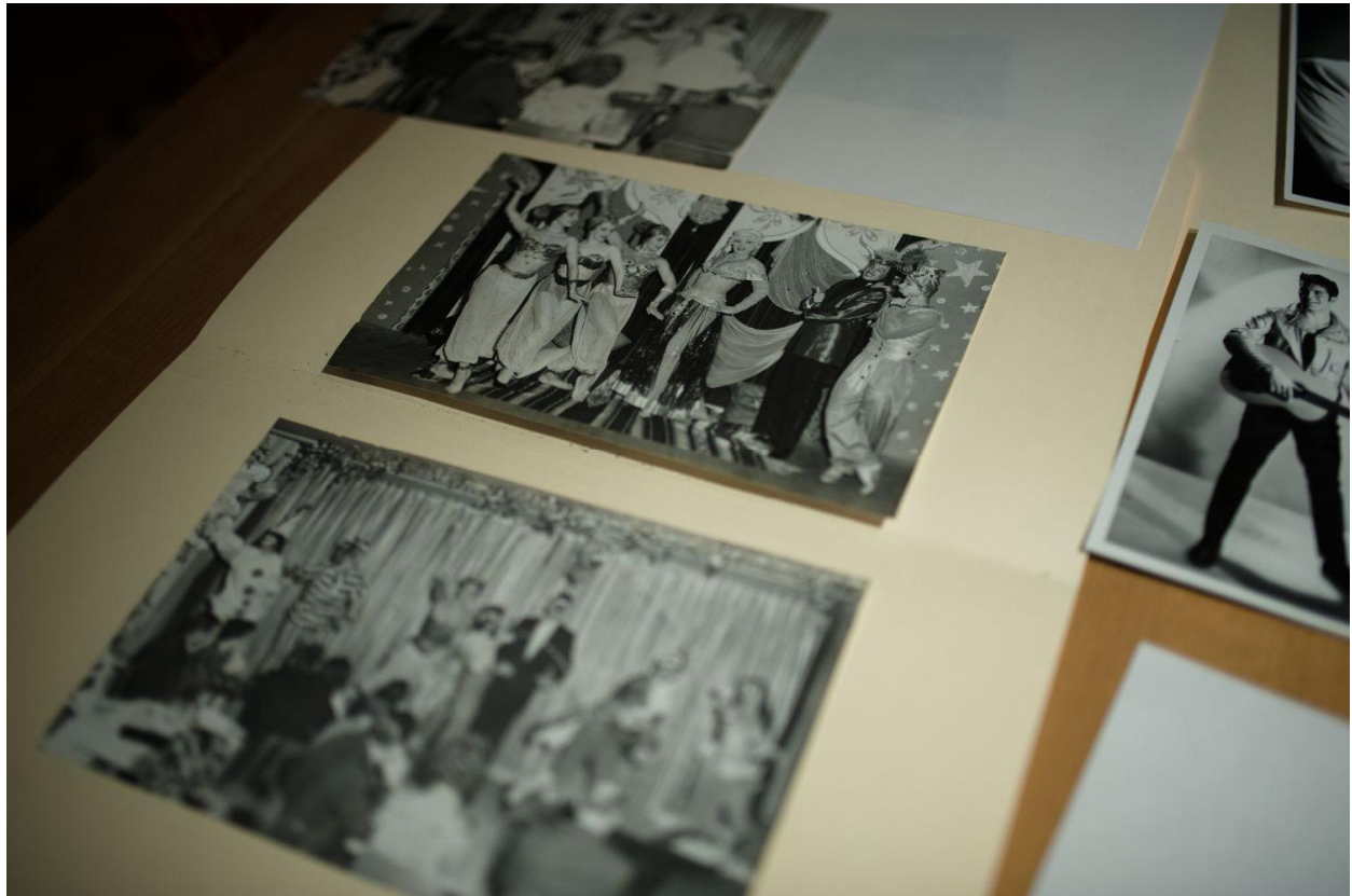
Les Archives gaies du Québec sont aujourd'hui logées dans un local de la rue Amherst, dans le Village gai.

Et la première condamnation recensée, dont on retrace l'histoire dans les Archives gaies du Québec, se déroule en 1648, six ans après la fondation de Montréal. Un jeune soldat est alors accusé du « pire des crimes ». Alors qu'il aurait dû être expédié aux galères, les Jésuites interviennent en sa faveur. Sa sentence est commuée à condition qu'il devienne le premier bourreau de la Nouvelle-France.