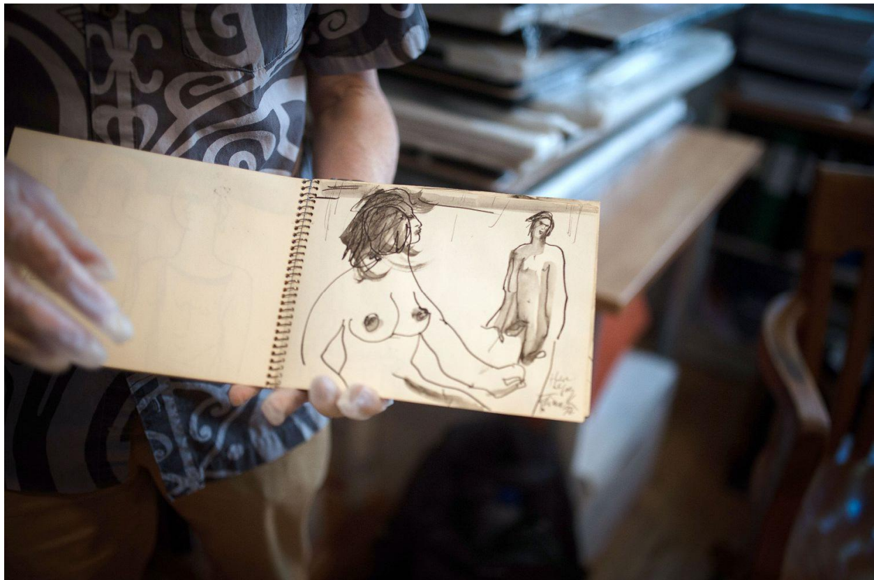
Les Archives gaies documentent aussi l'histoire du lesbianisme au Québec, même si celui-ci a été plus discret au fil des époques.

On y trouve aussi des archives privées, comme celles données par la succession de Guilda, alias Jean Guida de Mortellaro. C'est dès les années 1950 que cet artiste travesti se produit sur les scènes du Québec, malgré l'opprobre du clergé.