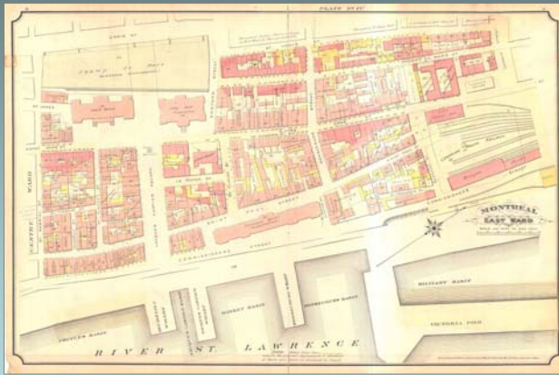
Carte de Montréal en 1890 avec le Champ de Mars en haut à gauche, collection BNC.