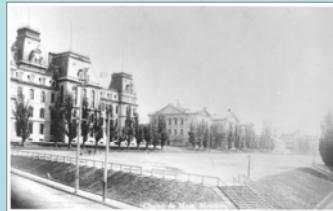
Photo du Champ-de-Mars