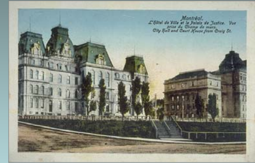
Carte postale du Champ-de-mars, collection BNC.

« L'Association nocturne », La Presse, 30 juin 1886. Nous remercions Cypille Folléau qui a reproduit cet article dans son Histoire de La Presse, Les éditions La Presse, Montréal, 1983.