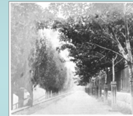
Photo des peupliers au Champ-de-Mars, Archives nationales du Canada PA 84490