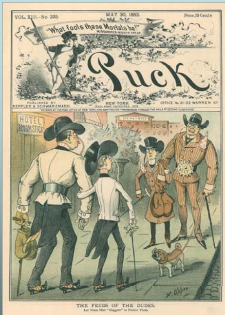
Couverture de Puck, (New York) 30 mai 1883. « The Feuds of the Dudes » (Conflits des dandys).